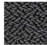
King SK1 81.30

Das Netzgewebe gibt es in zeitlosem schwarz und anthrazit. Le tissu résille existe en deux coloris intemporels: noir et anthracite. The mesh fabric is available in timeless black and anthracite.