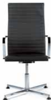
250.4100 + al251