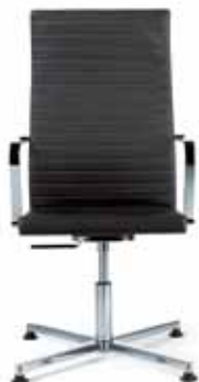
250.4000 + al251