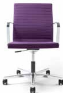
250.1110 + al250-01