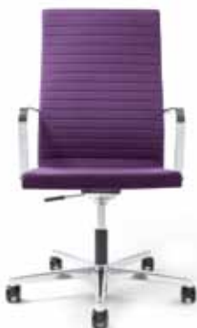
250.4010 + al251-01