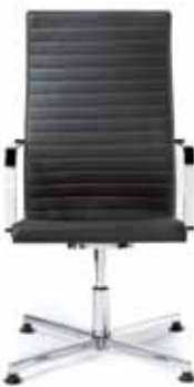
250.3000 + al251