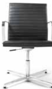
250.1010 + al250-01