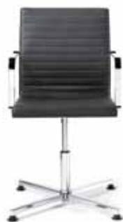
250.1100 + al250