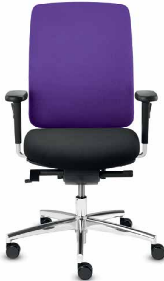
DS+ DA 80615 + Armlehnen/Armrests 172

Swivel chair with mesh backrest with upholstered cushion (82 cm) as well as multi-functional 4F armrests with aluminium polished armrest posts. Delta-Synchron-plus mechanism with seat-tilt and seat-depth adjustment. The height-adjustable, upholstered neckrest offers maximum comfort for relaxed sitting. ble mesh neckrest offers maximum comfort for relaxed sitting.