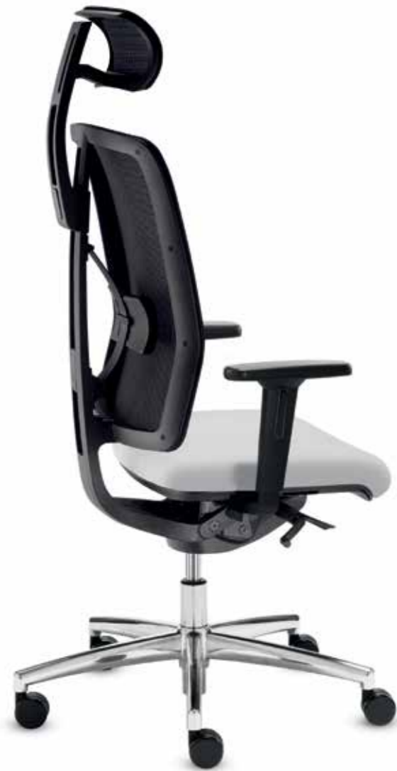
DS+ DA 80515 + Armlehnen/Armrests 171

Drehstuhl mit hoher Netz-Rückenlehne und Nackenstütze (82 cm) . Die Delta-Synchron-plus-Mechanik ermöglicht entspanntes Relaxen mit einem Öffnungswinkel bis zu 128°. Multifunktionale Armlehnen mit weichen PU-Auflagen.