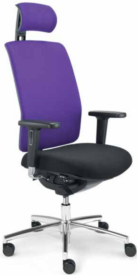
DS+ DA 80715 + Armlehnen/Armrests 172

Drehstuhl mit Netz-Rückenlehne und Polsterauflage (82 cm) sowie multifunktionalen 4F-Armlehnen mit poliertem Aluminium-Träger. Delta-Synchronplus-Mechanik mit Sitzneige- und Sitztiefenverstellung. Die stoffbezogene, höhenverstellbare Nackenstütze lässt den Be-Sitzer optimal entspannen.