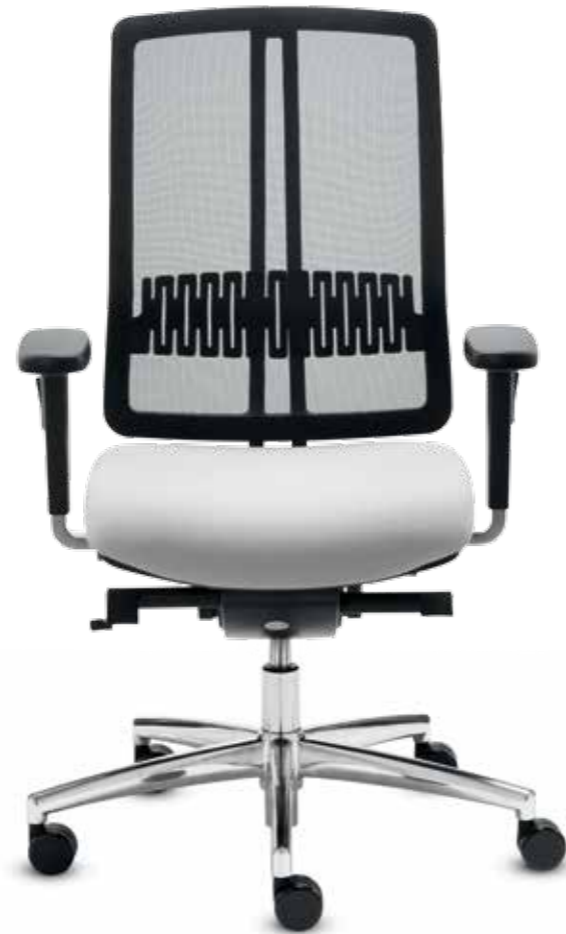
DS+ DA 80315 dat-o S + Armlehnen/Armrests 172

Swivel chair with high mesh backrest and neckrest (82 cm) . The Delta-Synchron-plus mechanism allows relaxed sitting with an opening angle up to 128°. Multi-functional armrests with soft PU armpads.