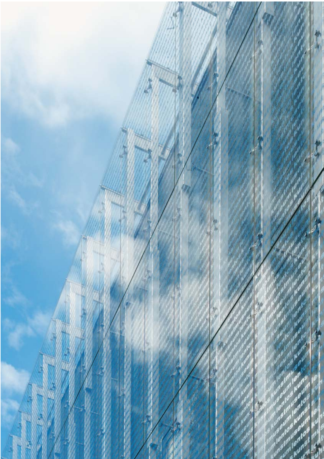
Lentos Kunstmuseum Linz, Österreich