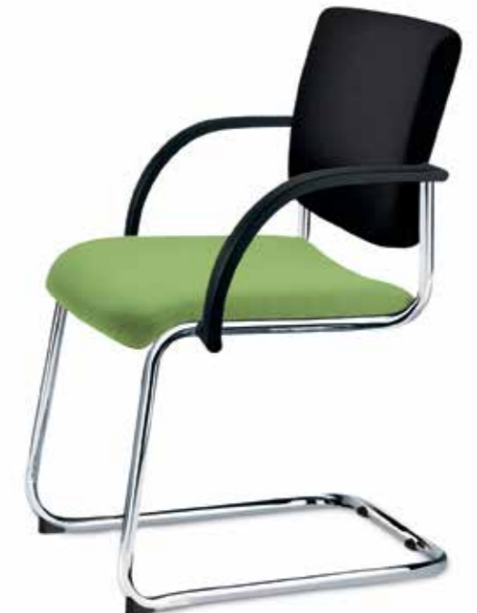
GO 91060 + Armlehnen/Armrests 033

Four-legged chair with medium-high mesh backrest (backrest height 42 cm) . The frame, which can be stacked up to 6-high, is available either in black or optionally chromed. The four-legged chair is available without or with armrests.