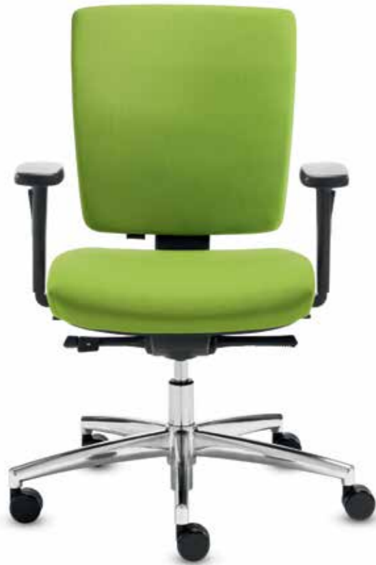
QS+ GO 82115 + Armlehnen/Armrests 155

Drehstuhl mit mittelhoher, 9 cm höhenverstellbarer Rückenlehne (50 cm) mit Kunststoff-Außenschale, Syncro-Quickshift®-plus-Mechanik mit einer Schnellverstellung des Rückenlehnegegendrucks (10 Stufen). Die höhen- und breitenverstellbaren Armlehnen sind mit weichen PU-Armauflagen ausgestattet.