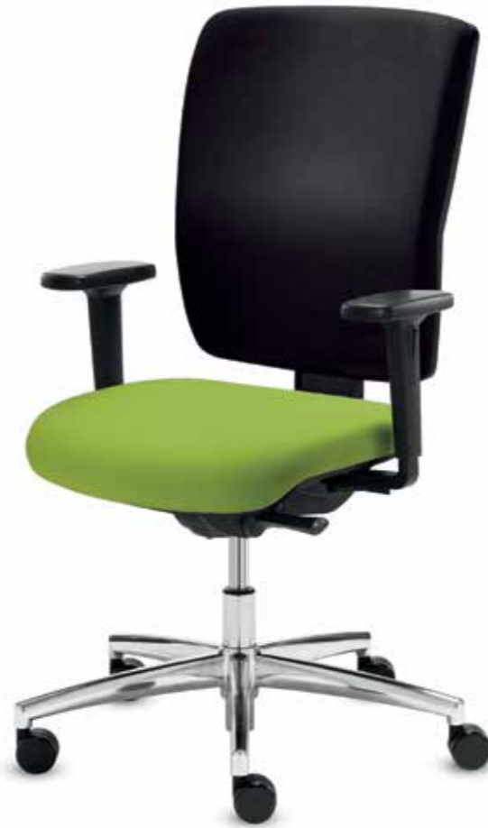
QS+ GO 82215 + Armlehnen/Armrests 155

Swivel chair featuring a medium-high, 9 cm height-adjustable backrest (50 cm) with plastic outer shell, Syncro-Quickshift®-plus mechanism with a rapid adjustment of the backrest tension (10 steps). Height and width-adjustable armrests with soft PU pads.